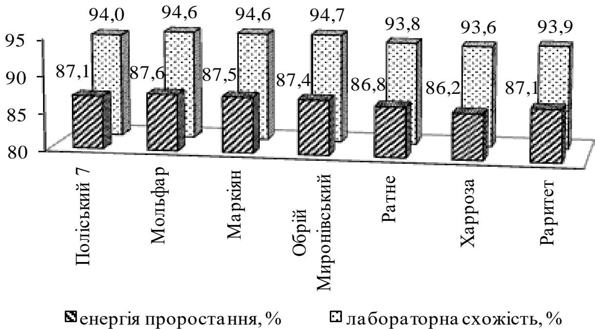
Рис. 2 Енергія проростання й лабораторна схожість насіння сортів тритикале озимого, 2015-2017рр.

Однією з причин низької адаптивності сортів зернових культур є стійкість до явища ензимо-мікозного виснаження зерна, яке має місце у зоні Лісостепу Західного України. За середніми даними у роки досліджень висока маса 1000 насінин 44,2–48,3 г у повну стиглість знижувалася при перестойі зерна на корені під впливом ензимо-мікозного виснаження.